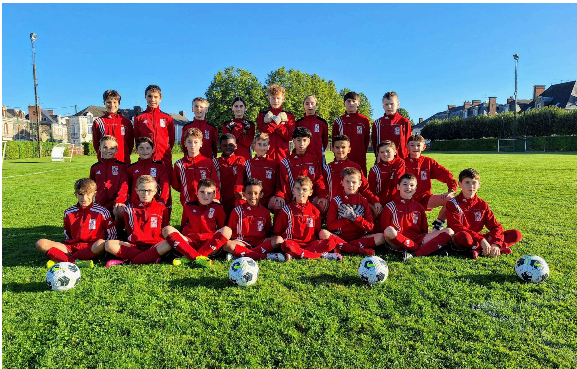
Année 2024-2025 / Groupe 6è-5è (26 élèves)