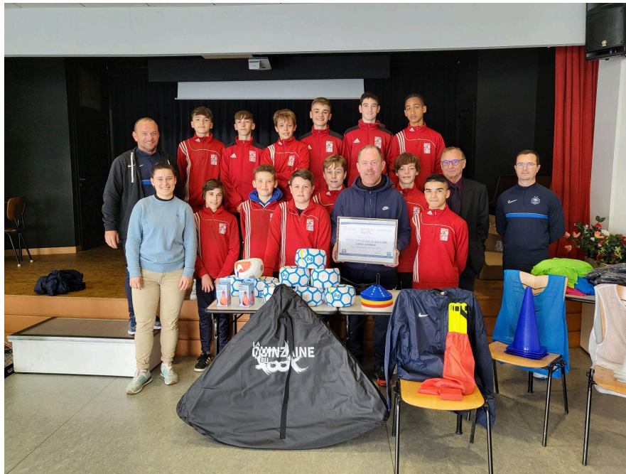
Projet “QUINZAINE DU FOOT CITOYEN” 1er Lauréat Régional (4ème nationale - 2022)