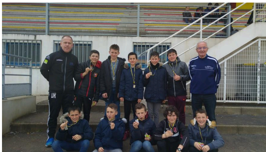
Médaille de Bronze au Régional UGSEL Benjamins à Landivisiau (29) (Saison 2017-2018)