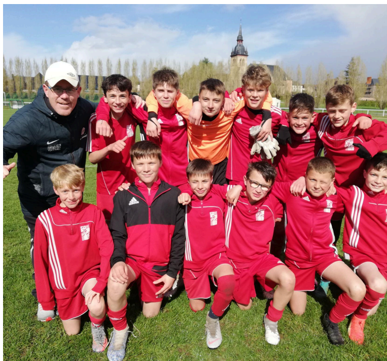
Champion District 35 (Avril 2023) Vice-Champion UGSEL 35 (2018 et 2019) / Vice-Champion District 35 (2017 et 2018)