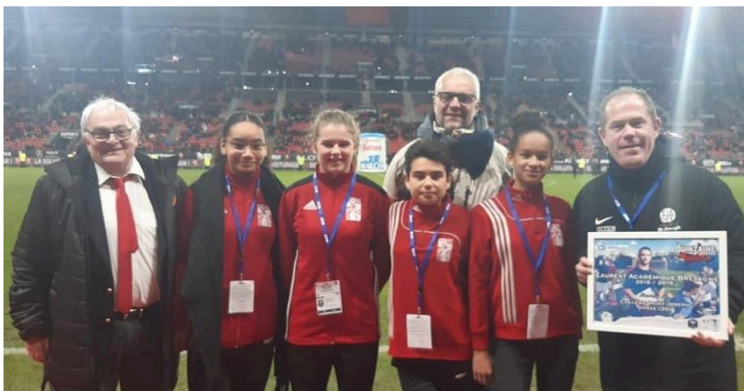
Projet "QUINZAINE DU FOOT CITOYEN" 1er Lauréat Régional 2019 et 2021 (2ème nationale en 2019)