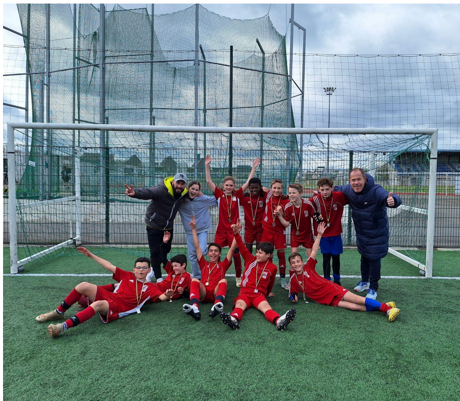
Equipe 6ème - 5ème / Champion UGSEL Promotionnel Benjamins (2020 et 2022) Vice-Champion Promotionnel Benjamins (2023 et 2024)