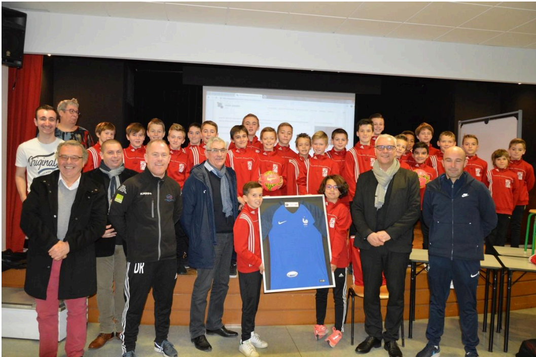
Projet "QUINZAINE DU FOOT CITOYEN" 1er Lauréat Régional - 8ème place Nationale (2018)