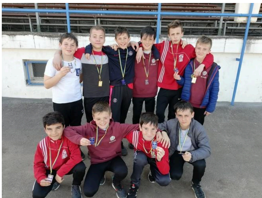
Champion de Bretagne UGSEL Benjamins à Languidic (56) (saison 2018-2019)