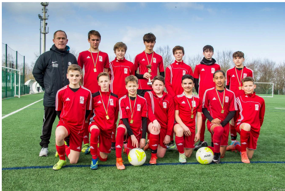
Vice-Champion de Bretagne UGSEL Elite Minimes à Ploermel (56) (saison 2021-2022)