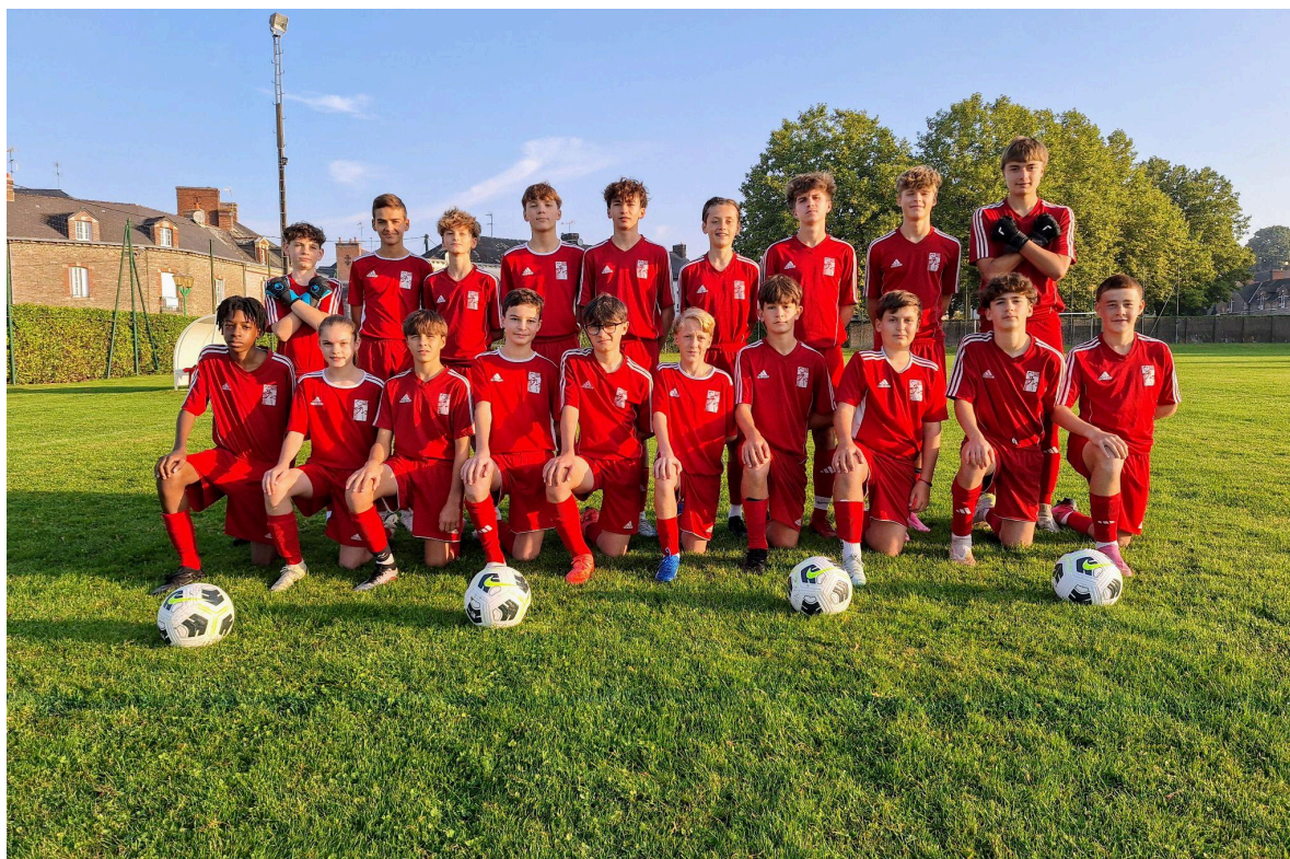
Année 2024-2025 / Groupe 4è-3è (19 élèves)