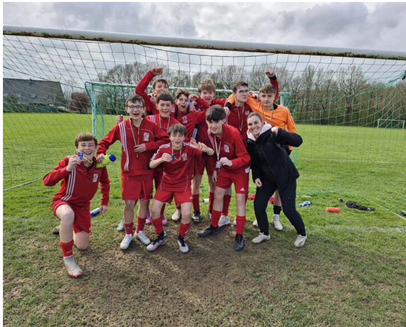
Equipe 4ème - 3ème / Vice-Champion de Bretagne UGSEL Elite Minimes à Ploermel (56) Année 2023 - 2024